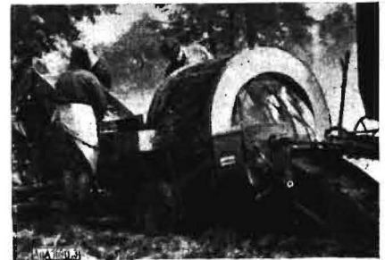
Bild 3. Maschine C, Heag-Roder