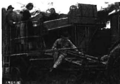
Bild 1. Maschine A, DDR-Entwicklung

1.2 Rodeleistung und Auslastung der Maschinen ergaben sich im Zusammenhang mit Flächenmessungen aus dem für jede Maschine