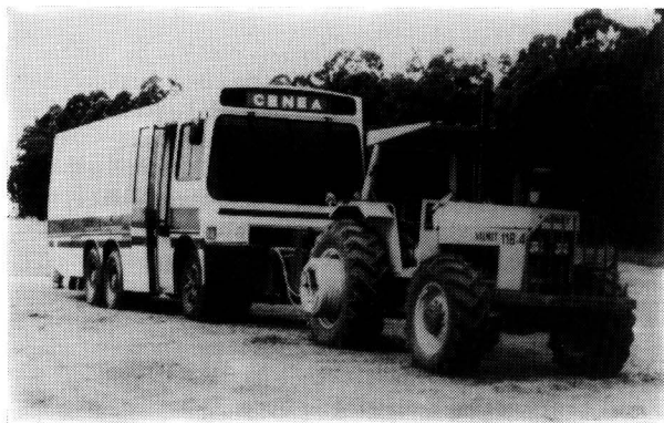
Bild 2. Zugkraftmeßwagen für die Schlepperprüfung des nationalen brasilianischen Landtechnikzentrums CENEA, der mit deutscher Unterstützung entwickelt und gebaut wurde.

Die Bedeutung solcher Zentren für den Technologieaustausch wird dadurch unterstrichen, daß internationale Institutionen wie die Food and Agriculture Organization (FAO) und die United Nations Industrial Development Organization (UNIDO) ihre Förderung ausdrücklich empfehlen [6, 7]. Auch die Bundesrepublik hat den Aufbau agrartechnischer Zentren in verschiedenen Ländern massiv unterstützt.