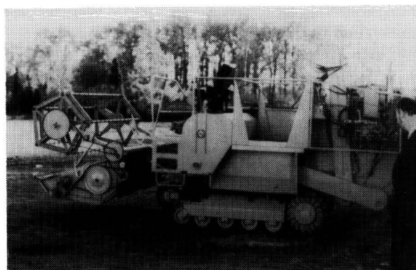
Bild 1. Von der Fa. Claas in Kooperation mit chinesischen Partnern entwickelter kleiner Reismährescher mit Gummi-Raupenfahrwerk; abgebildet ist der in der VR China gefertigte Prototyp.

Solche Vorhaben können bei vorliegender Interessenäußerung seitens des Partnerlandes ebenfalls über Bundesmittel gefördert werden.