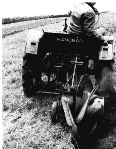
Bild 1 und 2. Oldensworter Schraubenpflug in seiner ursprünglichen Form. Mit ihm wurden die nachstehenden Messungen durchgeführt.