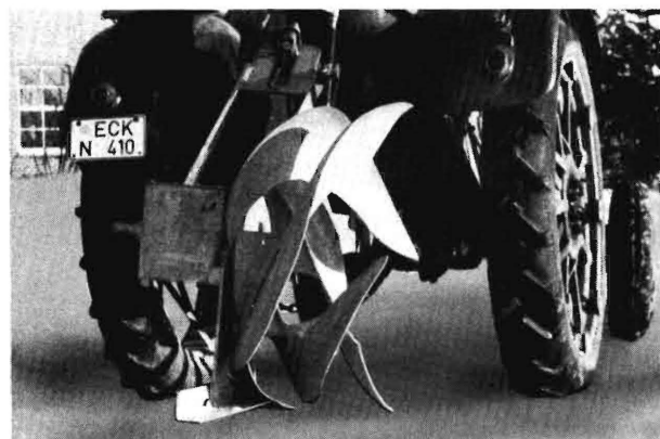
Bild 3 und 4. Neuer Oldenswörter Schraubenpflug mit gekürztem Schar und verlängerten Flügeln.