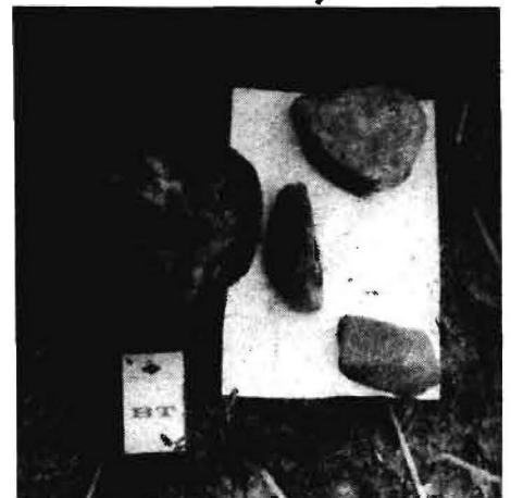
Bild 3 Durch FORTSCHRITT-Fremdkörperortung ausgesonderte Steine