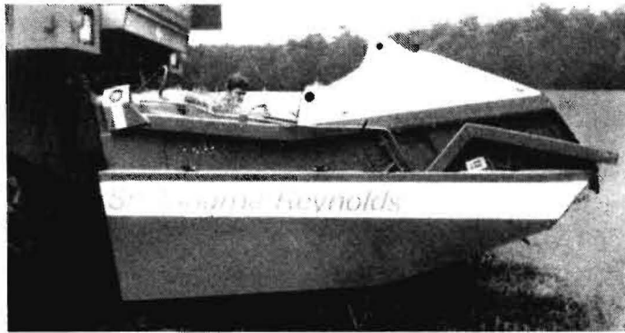
Bild 1 Ährenpflücker (Grain Stripper) der englischen Firma Shelbourne Reynolds

Die Kapazität der in Ungarn eingesetzten Mähdrescher reicht nicht aus, um die Weizenernte in der optimalen Druschzeitspanne beenden zu können. Kapazitätssteigerungen sind entweder durch Anschaffung weiterer Maschinen oder durch Erhöhung des Durchsatzes der vorhandenen Mähdrescher möglich. Ein höherer Durchsatz kann dadurch erreicht werden, daß mit einem speziellen Versatz anstelle des konventionellen Schneidwerks nur die Ähren gepflückt werden. Dadurch belasten die Strohteile die Dresch- und Reinigungsorgane nicht. Aufgrund günstiger Erfahrungen mit den Ährenpflückern (Grain Stripper) in England wurde im Jahr 1988 vom IKR Babolna 1) der Adapter der Fa. Shelbourne Reynolds (Bild 1) an verschiedenen Mähdreschern geprüft. Dieser Adapter ist kein Schneidwerk im herkömmlichen Sinn. Er besteht aus einer schnell rotierenden Trommel, auf der in acht Reihen Gummifinger befestigt sind. Die Finger bilden schlüssellochförmige Öffnungen, in die die Getreidehalme gelangen. Die wie eine Aufnahme-trommel nach oben rotierenden Finger reißen die Ähren ab und fördern sie durch ein Förderband zur Förderschnecke.