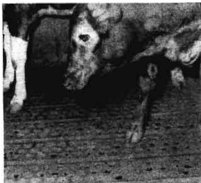
Bild 4. KT-Stahl-Laufboden für Mastschweine