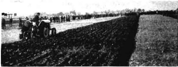
Bild 19. Die durch eine tiefe Ausstreichfurche hinter einem Zusammen-schlag verursachten hohen Mähdrescherstoppln konnte selbst die geschickteste Pflugeinstellung nicht restlos unterbringen

durchgeführten Arbeiten gegeben. Besonders interessiert haben uns Fragen der Kohäsion, Adhäsion und des Scherwiderstandes des Bodens, die Meßeinrichtung für die auf den Pflugkörper wirkenden Kräfte, die Beeinflussung der Bodendurchlüftung (Gasaustausch) durch den Radschlupf, ein Spezialgerät zur Testung von Schlepperreifen u. a.