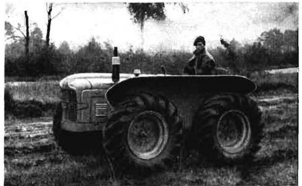
Bild 21. „COUNTY“ liefert seine Schlepper wahlweise mit Raupen oder Allradantrieb. Mögliche Reifengrößen: 13—24, bis 15—30! Steuerung durch Lenkgetriebe und einstelliges Bremsen

In England sind solche Pflugwettbewerbe eine Art landwirtschaftlicher Berufssport, an dem sich mit Begeisterung selbst noch Grauhaarige beteiligen. Über 100 örtliche Pflugvereine, in ihrer Bedeutung den Schießsport- (Schützen-) Verbänden gleichzusetzen, sind in einem Dachverband zusammengeschlossen, der jährlich eine Landesmeisterschaft durchführt. Dabei ist jeder bestrebt, unter den kritischen Augen