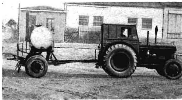
Bild 1. Jauchetiefdrillgerät in Transportstellung auf dem Hof der MTS in Murchin, Kreis Anklam. Normalerweise wird es von einem RS 14/30 gezogen

Bei den Überlegungen über die zweckmäßigste Verwendung der Jauche gingen der Vorstand und der Berater der LPG