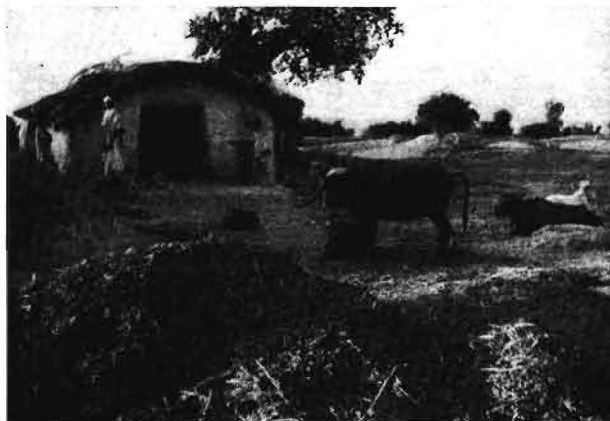
Bild 10. Bauerngehöft - die vorhandenen Tiere befinden sich mit dem unzureichenden Futtermittel, unmittelbar der Sonne ausgesetzt, vor der Wohnanlage