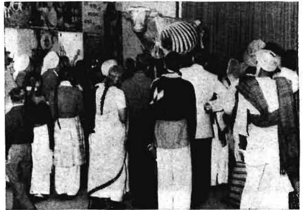
Bild 5. Die „Gläserne Kuh“, ein Hauptanziehungspunkt im DDR-Pavillon

Weiterhin war für alle Besucher unseres Pavillons die Modelldarstellung unseres vollgenossenschaftlichen Dorfes Trinwillershagen ein starker Anziehungspunkt. Etwa 80% der indischen Bevölkerung leben in rd. 550 000 Dörfern und für diese Menschen gibt es die vielfältigsten Probleme, wie Bodenreform, Bildungsmöglichkeiten, soziale Betreuung usw., die in unserem Staat durch eine richtige Agrarpolitik gelöst sind. Nicht zuletzt erzielten wir mit der Darstellung der genossenschaftlichen Entwicklung deshalb ein starkes Echo, weil gegenwärtig in Indien eine von der Regierung aktiv unterstützte Genossenschaftsbewegung, die sog. „Community Projects“ ins Leben gerufen wurde. Die bisherigen Ergebnisse dieser Entwicklung zeigen, daß darin ein Anfang gesehen werden kann, die großen Probleme der indischen Landwirtschaft zu lösen. Die Bedeutung der Darstellungen über die LPG in der DDR drückte der indische Landwirtschaftsminister nach eingehender Information am Modell folgendermaßen aus: „Gruppe um Gruppe werde ich Ihnen herschicken, um die Möglichkeiten und den Erfolg der kooperativen Arbeit sehen und erkennen zu lassen“. Wer die tatsächlichen Verhältnisse der indischen Landwirtschaft kennt, wird auch verstehen, warum unseren Darstellungen über die genossenschaftliche Wirtschaftsweise in Neu Delhi so breites Interesse entgegengebracht wurde. Die Probleme einer ausreichenden Nahrungsmittelproduktion beschäftigen die verantwort-