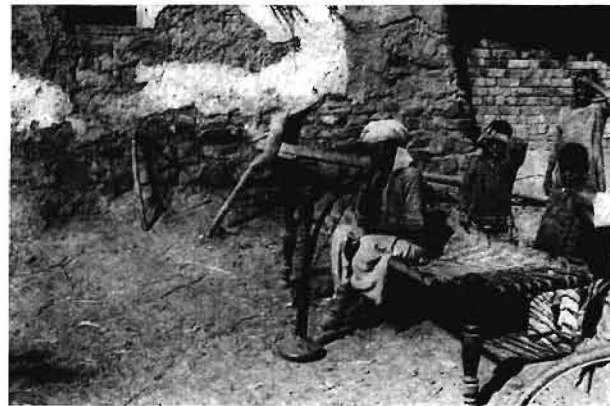
Bild 9. Die Wasserpeife ist das Lieblingsinstrument des indischen Bauern. Sogar bei den Feldarbeiten ist sie auf dem Acker vorzufinden