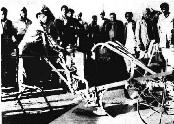
Bild 4. Unsere Kleingeräte fanden entsprechend den indischen Landwirtschaftsverhältnissen besondere Beachtung

vorzuheben ist aber auch das starke Interesse nicht nur an der landwirtschaftlichen Entwicklung in unserem Staat, sondern auch an den Problemen der beiden deutschen Staaten, an unserer Stellung zur Wiedervereinigung usw., so daß in Neu Delhi kaum ein Gespräch geführt wurde, ohne nicht auf Fragen der gegenwärtigen Situation in Deutschland zu kommen. Mit Befriedigung konnten wir immer wieder feststellen, daß die indische Bevölkerung, die die Politik der Koexistenz ihrer Regierung unterstützt, unserer Wiedervereinigungspolitik alle Sympathie entgegenbringt und demgegenüber der Entwicklung in Westdeutschland, vor allem in der jüngsten Vergangenheit, sehr kritisch gegenübersteht.