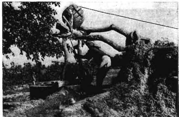
Bild 7 und 8. Der Holzpflug, das selbstgebaute Schöpfwerk am Wasserbrunnen, der zweirädrige Ochsenkarren sind die bestimmenden Produktionsmittel für den indischen Bauern