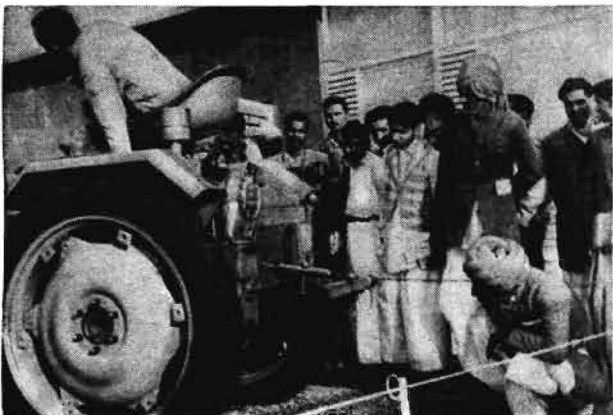
Bild 6. Der Geräteträger RS 09 in der Maschinenausstellung der DDR war Hauptanziehungspunkt

Hiermit soll allerdings nicht gesagt werden, daß nur der Geräteträger vom Schlepperwerk Schönebeck eine starke Beachtung fand, auch der Weidemelkstand vom VEB Elsterwerda, die Saatreinigungsanlagen vom VEB Petkus in Wutha, die Erntebereinigungsmaschinen vom VEB Fortschritt Neustadt sowie die Bodenbearbeitungs- und Schädlingsbekämpfungsgeräte vom VEB Bodenbearbeitungsgeräte Leipzig interessierten die Besucher außerordentlich (Bild 4).