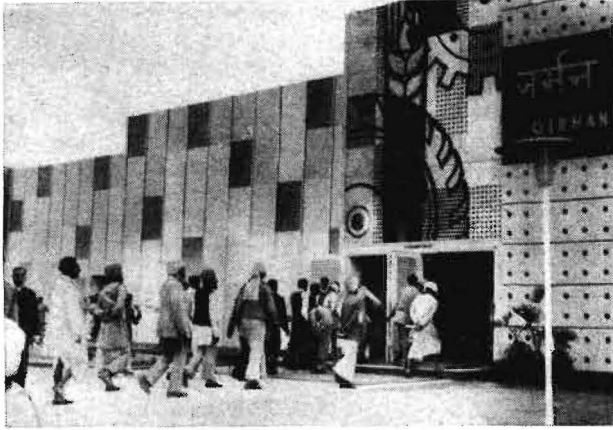
Bild 1. Blick auf den DDR-Pavillon