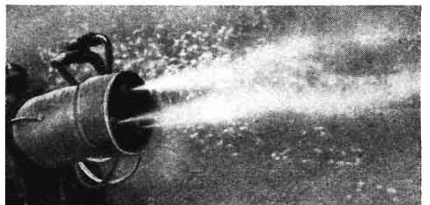
Bild 2. Gleichmäßig verläuft der Nebel die Düsen, die Nebelwolke nimmt sich allerdings recht bescheiden aus

Obwohl die Temperaturen in der Nacht auf -1 bis -2 °C absanken, war das Abtötungsergebnis ausgezeichnet. Schon nach dem 1. Einsatztag fand dieses Verfahren die Zustimmung der Genossenschaftsbauern und Obstzüchter. Auch für uns waren diese Ergebnisse beruhigend, zumal eine Behandlung von 2500 ha vorgesehen war und auch aus anderen Gebieten noch keine Ergebnisse über die Bekämpfung dieses Schädlings auf Großflächen im Nebelverfahren vorlagen. Obwohl sich das Wetter wenige Tage nach Beginn stark verschlechterte, war nach 12 Tagen das gesamte Gebiet behandelt. Nicht nur Frostspannerraupen wurden sicher bekämpft, auch gegen die schon recht weit entwickelten Raupen des Roten und Grauen Knospenwicklers gab es einen beachtlichen Abtötungserfolg.