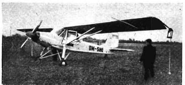
Bild 5. Vor dem Einsatz werden die Düsen noch einmal überprüft

Vom Flugzeug wurden die Ulspühmittel „FI 59“ und „Bercema-Aero-Sprüh 3 Liter“, das erste in einer Aufwandmenge