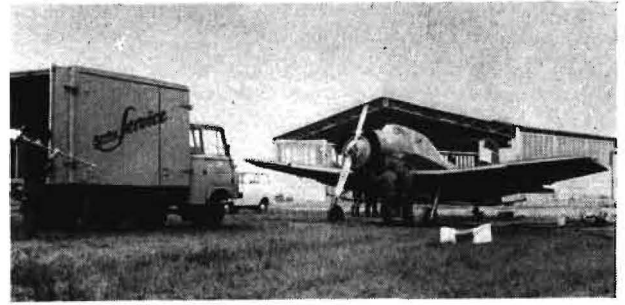
Bild 1. Agrarflugservice im ACZ der BHG Laußig; im Hintergrund die Unterstellhalle für Flugzeuge

Im Verlauf der Jahre hat sich das avio-chemische Arbeitsartenspektrum ständig erweitert. Der gegenwärtige Stand ist Tafel 1 zu entnehmen. Im Bereich der Düngung entwickelt sich die bestandsschonende und bodendruckfreie späte Stickstoffdüngung (Schosserdüngung) und im Pflanzenschutz die Bekämpfung der Kartoffelkrautfäule zu avio-chemischen Primärarbeiten. Leider können die verstärkten Anforderungen der Hauptproduzenten von Getreide und Futterleguminosen nach der Anwendung von Aeroherbiziden bzw. chemischen Defolianten mangels geeigneter chemischer Mittel nicht erfüllt werden. Spezielle Untersuchungen des Nutz-